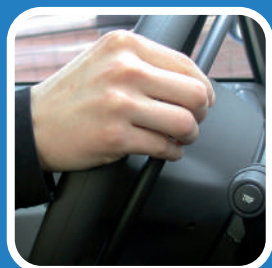
A. Den Gasring zum Lenkrad ziehen

K5 easy-fit: die Beschleunigung erfolgt sowohl beim Ziehen als auch beim Drücken des Gasrings. Der Fahrer kann damit sein Fahrstil an der Wegstrecke ständig anpassen. Die unterschiedlichen Fahrstile unseres K5-Gasrings sind: