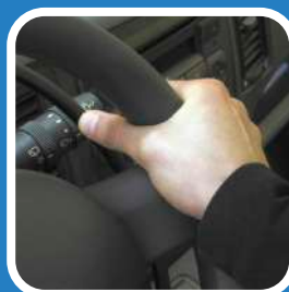
C. Den Gasring mit dem Daumen innerhalb des Lenkrads drücken