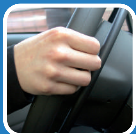
B. Den Gasring nach Armaturenbrett drücken