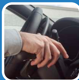
D. Den Gasring mit dem Daumen drücken und die Hand auf dem vertikalen Bremshebel halten.